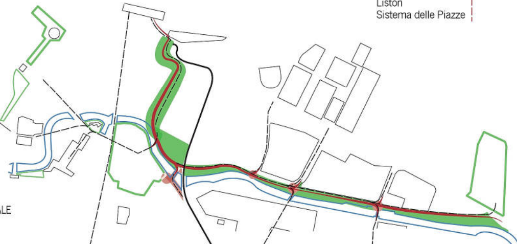
SCHEMA DEL FILO PEDONALE